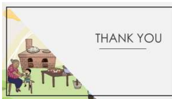
(圖)7.3 華人歷史與文化