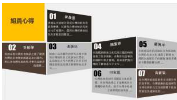
(圖)5.3 華人歷史與文化