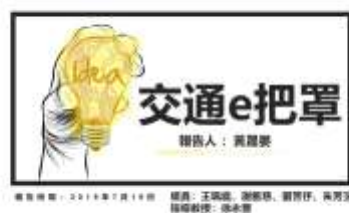
(圖)1.2 桃園樂桃桃資訊比賽