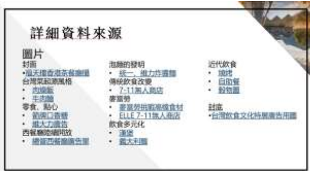
(圖)6.1、6.2 華人歷史與文化