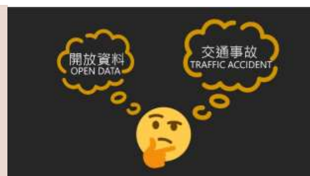
(圖)3.2 桃園樂桃桃資訊比賽