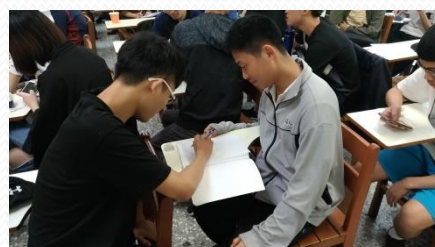
同學們課堂討論報告設計