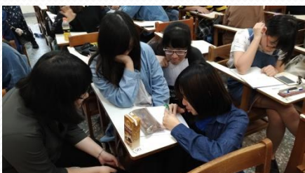
教學助理參與同學們課堂討論