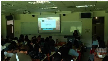
教學助理分享製作報告的經驗