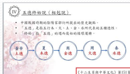
PPT報告附上資料出處-1