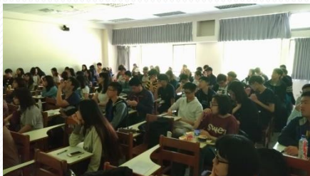
同學們聆聽教學助理報告的狀況