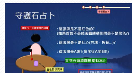
PPT報告附上資料出處-2